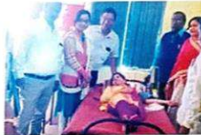
शिविर में रक्त दान करती छात्रा

विद्यार्थी एवं शिक्षक सहित छात्र-छात्राओं ने शिविर में रक्तदान किया। कार्यक्रम का शुभारंभ छात्र-छात्राओं के द्वारा किया गया।